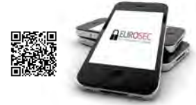
Tilgang til databasen via smarttelefon