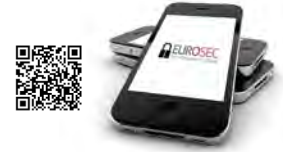
Adgang til databasen via smartphones